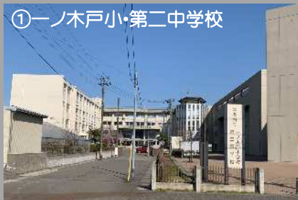
①一ノ木戸小・第二中学校