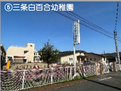
⑤三条白百合幼稚園