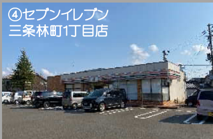
④セブンイレブン 三条林町1丁目店