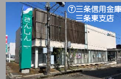
⑦三條信用金庫 三條東支店