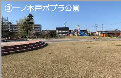
③一ノ木戸ポプラ公園