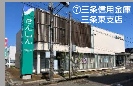
⑦三条信用金庫 三条東支店